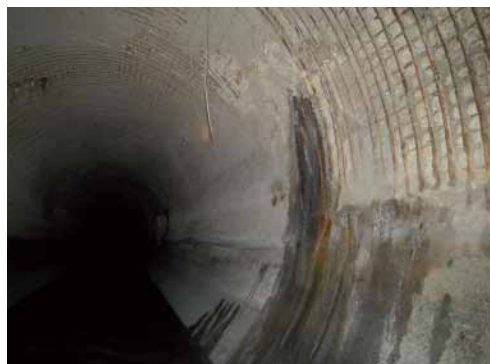
Condiciones del recubrimiento del Emisor Central.

El grado de riesgo se determinará a partir del diagnóstico derivado de la inspección realizada y su mitigación dependerá del avance en las reparaciones que se realicen anualmente.